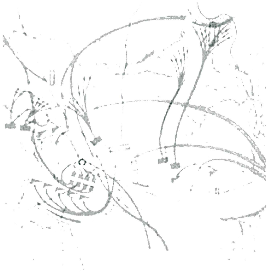
Рисунок 1 – План Бородинского сражения